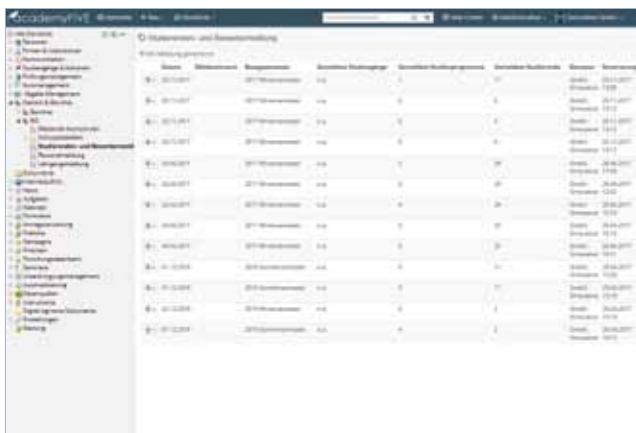
Studierenden- und Bewerbermeldung