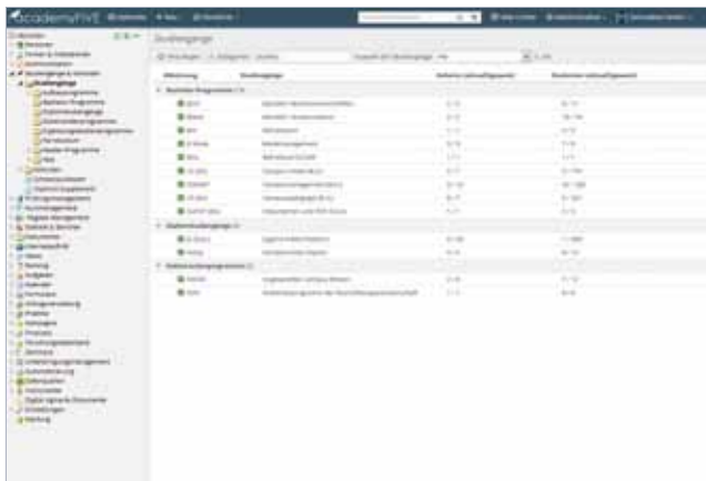
Studiengänge mit Kategorisierung