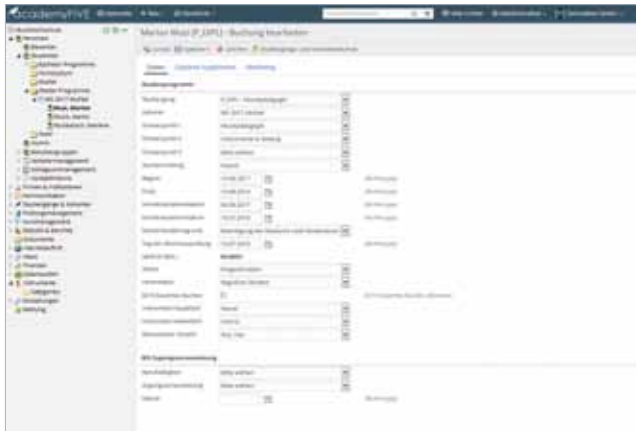
Buchung mit Schwerpunkt, Haupt- und Nebenfachinstrument